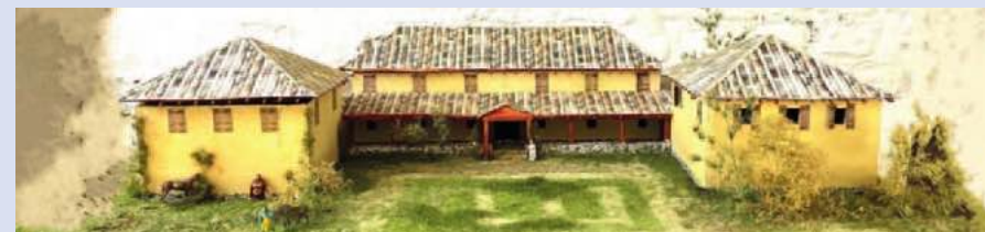
Maquette van de Villa van Maasbracht-Steenakker door Coen Thevissen.

(ca. 50x30m) geheel en het bijbehorende erf gedeeltelijk opgegraven. De resultaten van de opgraving werden in 2017 gepubliceerd. 8 Volgens één van de auteurs van het rapport is het de vraag, of hier sprake is van een villa rustica (herenboerderij) of, gezien de kostbare inrichting, een villa urbana (luxueus buitenverblijf).