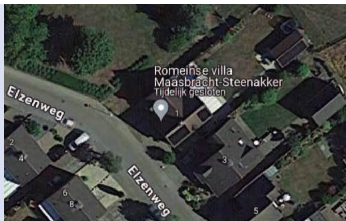
Volgens Google Maps (11-8-2024) is de Romeinse villa tijdelijk gesloten!!!

De weinige oudste vondsten dateren uit de vroeg-Romeinse tijd.