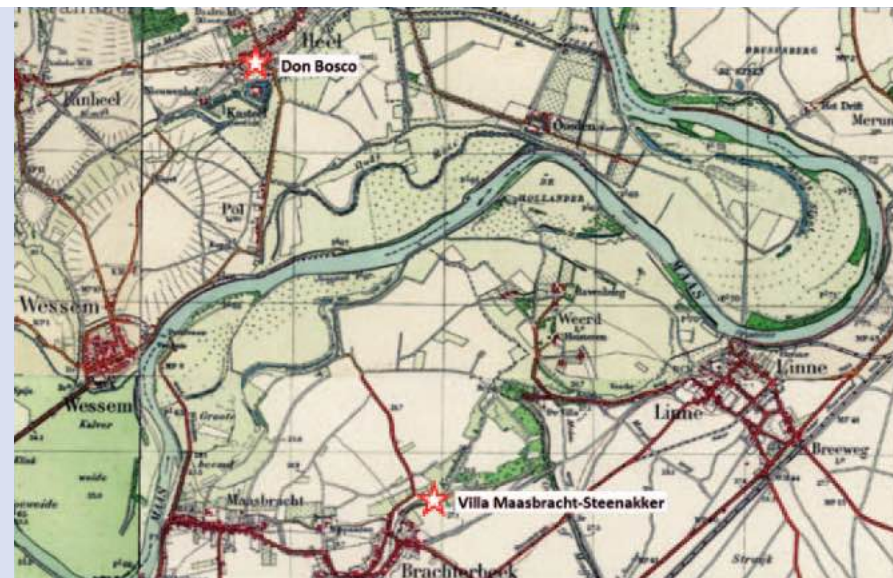
Het landschap tussen Heel en Brachterbeek in 1920 vóór de grootschalige ingrepen van de mens.

Aan de overkant van de Maas liggen op ca. 400m ten zuidoosten van de Clauscentrale de resten van de Romeinse villa van Maasbracht-Steenakker. De villa ligt op de hoge rand van het middenterras van de Maas tussen de mondingen van de Vlootbeek en de voormalige Krombeek. 7 In 1982 is van dit complex het hoofgebouw